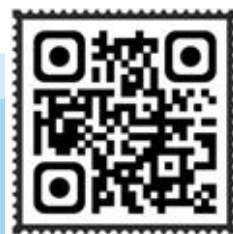
四川省学生资助 管理中心网站