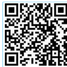
全国学生资助 管理中心网站