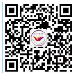
“中国学生资助” 微信公众号