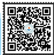
“四川学生资助” 微信公众号

本简介内容及相关文件可登录全国学生资助管理中心网站( https://www.xszz.edu.cn/ )和“中国学生资助”微信公众号查阅